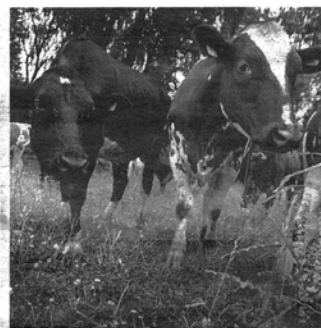
Färre svenska kor oröar LRF.